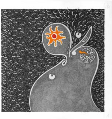
Pelagocentottantasei, 2010 Tecnica mista su carta ,35x35 cm Collezione Gillo Dorfles