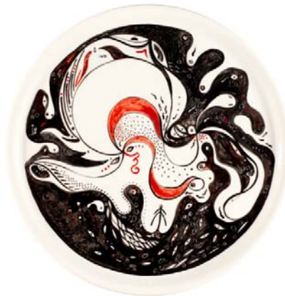
Schegge da Pelago n. 11, 2011 Piatto in porcellana, pezzo unico, diam.35 cm Collezione Gillo Dorfles