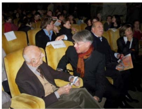
Gillo Dorfles con Donato Di Zio al Festival della creatività, Cinema Odeon, Firenze, 2010