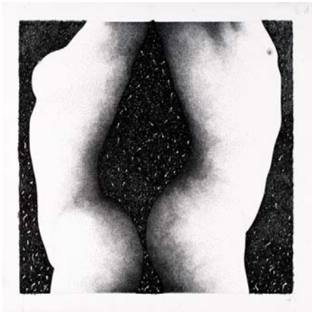
Francesca e Paolo (Inferno canto v ), 2003 Matita e inchiostro nero su carta, 34,8x35 cm