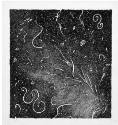
Pelagoduecentosette, 2011 Matita e inchiostro nero su carta, 35x35 cm