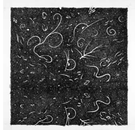
Pelagoduecentonove, 2012 Matita e inchiostro nero su carta, 35x35 cm