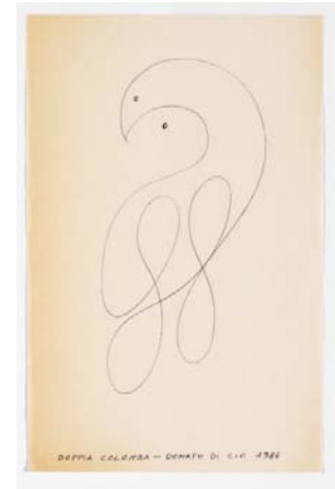
Doppia colomba, 1986 Penna nera su carta, 22x14 Collezione Biblioteca Marucelliana Firenze