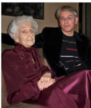
Rita Levi- Montalcini con Donato Di Zio, Roma 2009

Dal 15 settembre al 15 dicembre 2012 una nuova mostra dell'artista è ospitata negli spazi della prestigiosa Biblioteca Marucelliana di Firenze, con opere legate sia alla nuova produzione sia di periodi diversi, anche giovanili e del periodo liceale e accademico, per lo più inedite e pubblicate per la prima volta in questo nuovo volume. La mostra alla Biblioteca Marucelliana è di arricchita dalla pubblicazione di questo nuovo catalogo a cura Gillo Dorfles.